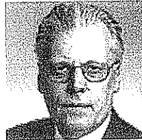
Mr Ögmundur JÓNASSON, Islandia, Miembro del Parlamento, Presidente de la Comisión Constitucional y de Supervisión