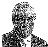
Mr Antonio COSTA, Alcalde de la Ciudad de Lisboa, Portugal